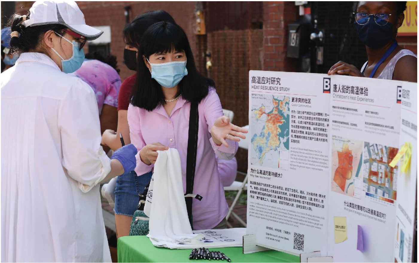
Nhiều cư dân của các cộng đồng có thu nhập thấp đang phải chịu nắng nóng khắc nghiệt, một tác hại của biến đổi khí hậu khiến họ đặc biệt dễ bị tổn thương trong đại dịch. Cư dân Khu Phố Tàu đã biết về các chiến lược xây dựng khả năng chịu nhiệt tại một buổi tụ tập ăn uống trong khu xóm do Hiệp Hội Cấp Tiến Trung Quốc tổ chức vào Tháng Tám, 2021.

ổn. Người Mỹ gốc Á dường như cũng dễ chấp nhận hơn những người khác về vai trò tích cực của chính phủ trong việc ủy quyền hoặc khuyến khích các hoạt động bảo vệ. Việc cởi mở với việc đeo khẩu trang có thể bị ảnh hưởng bởi thói quen đeo khẩu trang của người nhập cư và các hành động khác mà mọi người thường làm để bảo vệ bản thân khỏi vi rút và các chất ô nhiễm môi trường phổ biến ở một số quốc gia châu Á.